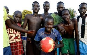
Fußballtraining Für den Ball hat das ganze Dorf zusammengelegt.