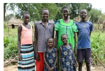
Dem Bürgerkrieg entkommen Bhan mit seinen Eltern und seinen Geschwistern.