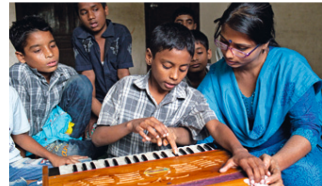
Auch Tanz und Musik stehen im „Haus der Fröhlichkeit“ auf dem Stundenplan.