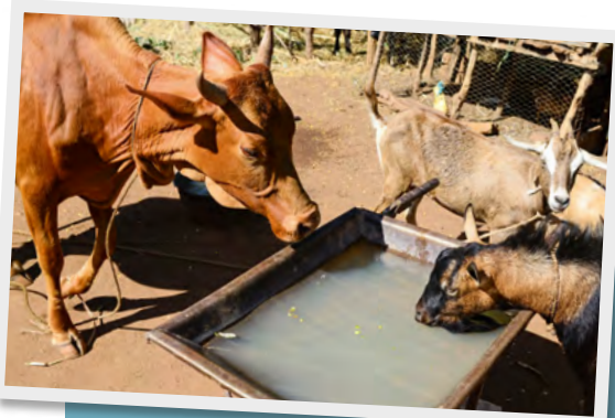
Alle Geschöpfe brauchen sauberes Wasser zum Trinken, auch die Tiere dieses Dorfes in Kenia.